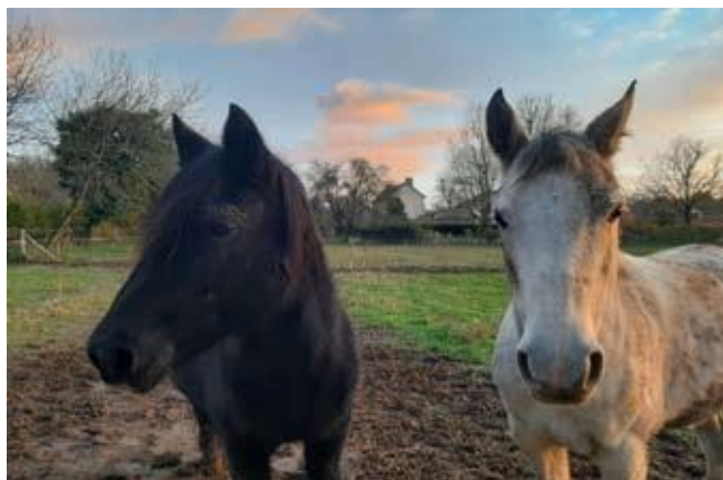
Oasis et la jument de la famille

Elle est finalement partie dans une nouvelle famille près de Persac en octobre 2024. Là-bas elle tient compagnie à Zambie, une jeune jument pur-sang arabe de 7 ans, et s'habitue progressivement à vivre dans une famille. Oasis fait régulièrement des promenades en main qu'elle apprécie beaucoup.